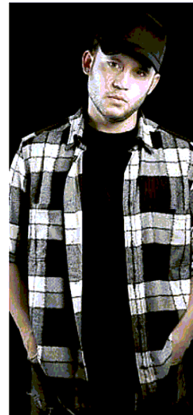
Qui sopra, a sinistra, la cantante romana Tosca, 52 anni. A destra, il rapper Rancore, pseudonimo di Tarek Iurcich, 30